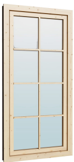
0.84×1.885 м.5 шт.