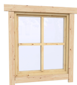
0.87×0.78 м.2 шт.